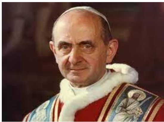
hl. Paul VI. (1963 – 1978)

Vor 60 Jahren starb Papst Johannes XXIII., der Initiator des Zweiten Vatikanischen Konzils. Und es sind 60 Jahre her, dass der Kenner und Freund der Schweiz, der damalige Erzbischof und Kardinal von Mailand, Giovanni Battista Montini, zum Papst gewählt wurde. Er nahm den Namen Paul an, in Erinnerung an den grossen Völkerapostel Paulus. Papst Paul VI. «erbte» von seinem unvergesslichen Vorgänger das Konzil und hat es verstanden, dieses zu einem guten Abschluss und in die nicht leichte Nachkonzilszeit zu begleiten. Beide bedeutende Persönlichkeiten sind unterdessen im Verzeichnis der Heiligen.